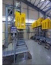
Gas Bottling Unit