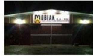
MOBIAK Balkans Branch (F.Y.R.O.M)