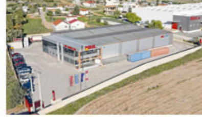
Warehouse in Athens - Greece