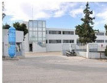
Warehouse in Heraklion - Crete