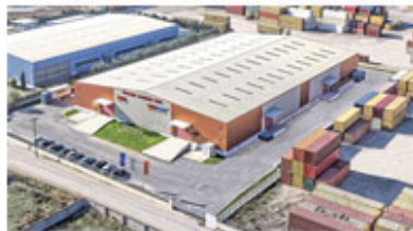
Warehouse in Thessaloniki - Greece