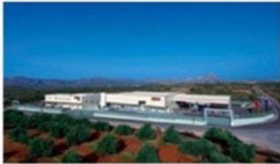
Central facilities – Factory in Chania – Crete- Greece