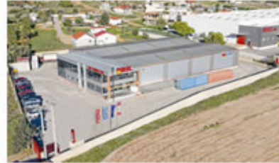
Warehouse in Athens - Greece