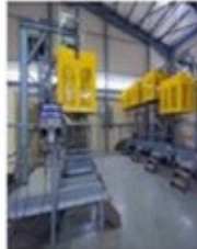
Gas Bottling Unit