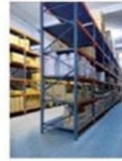
Warehouse in Crete