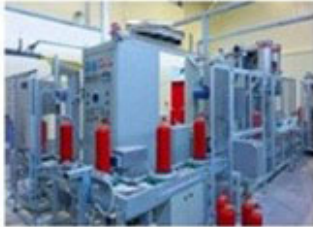
Automatic Production Line