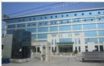
Εγκαταστάσεις στην Κίνα