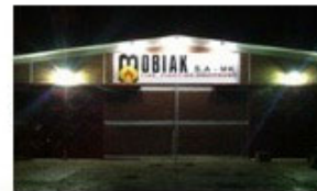
Παράρτημα στα Βαλκάνια (Σκόπια)