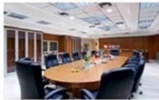
Αίθουσα Συνεδριάσεων - Έκθεση Προϊόντων