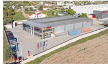
Κέντρο Διανομής Κεντρικής, Νότιας & Νησιωτικής Ελλάδος (Ασπρόπυργος, Θέση Νέα Ζωή, Αττική)