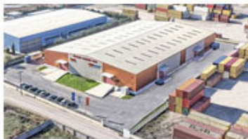
Κέντρο Διανομής Βορείου Ελλάδος & Βαλκανίων (Ιωνία, Καλοχώρι, Θεσσαλονίκη)