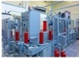
Στάδια Παραγωγικής Διαδικασίας