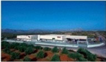
Κεντρικές Εγκαταστάσεις στα Χανιά της Κρήτης (Περιοχή Καθιανά, Ακρωτηρίου)