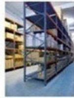
Αποθήκη Πρώτων Υλών & Ειδών Εμπορίας στην Κρήτη