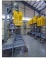
Μονάδα Αυτόματης Εμφιάλωσης Αερίων