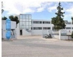
Κέντρο Διανομής Κεντρικής & Ανατολικής Κρήτης (ΒΙ.ΠΕ. Ηρακλείου, Κρήτη)