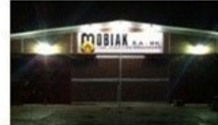
MOBIAK Balkans Branch (F.Y.R.O.M)