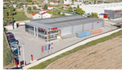
Warehouse in Athens - Greece