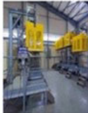
Gas Bottling Unit